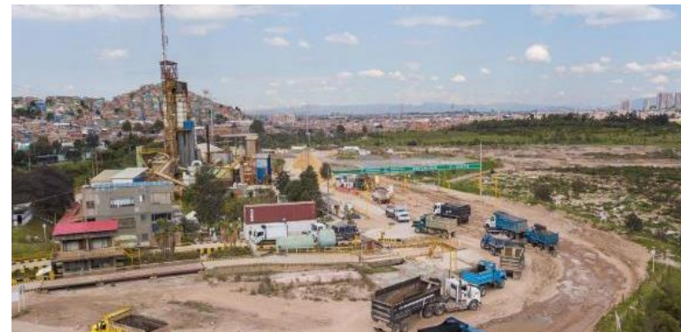
Centro de Circularidad Tunjuelo

1 millón de toneladas de residuos de excavación recuperados para reuso o reciclaje